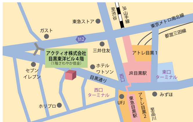
【最寄り駅】目黒駅西口 (JR山手線・東京メトロ南北線・東急目黒線・都営三田線) 徒歩3分

公開講座は参加される方の目的も把握しながら、それらを考慮して進めます。参加される方々の目的に出来る限り沿えるように、複数回の研修の途中で個別のセッションを取り入れるなど、参加者の状況に応じて進めていきます。また、講座を通して、上級コース、プロフェッショナルコースへの参加を終えられた方には、研修講師のプロとしても活躍できる場の創造にも力を入れていきたいと考えております。